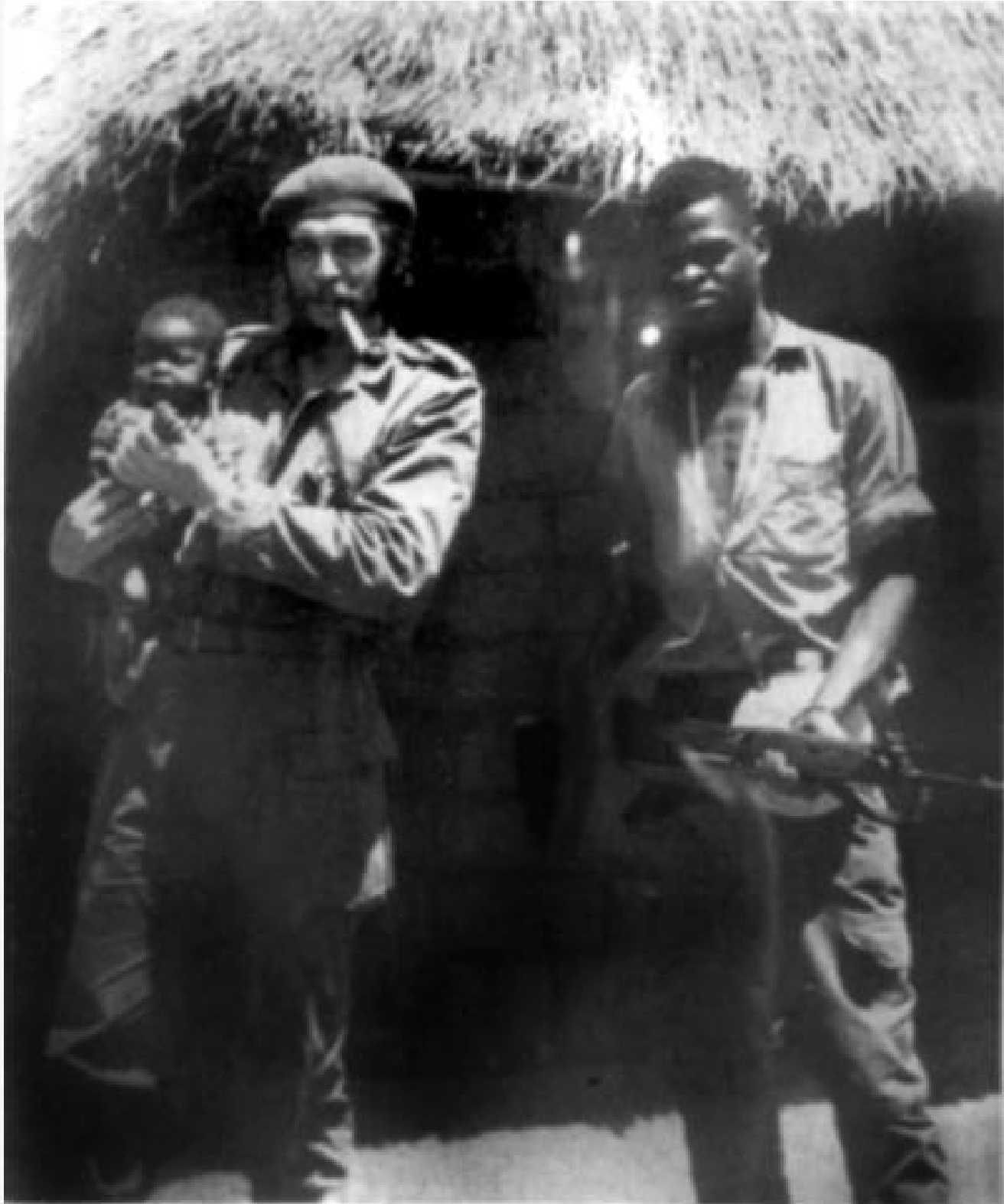
కాంగోలో చే. 1965