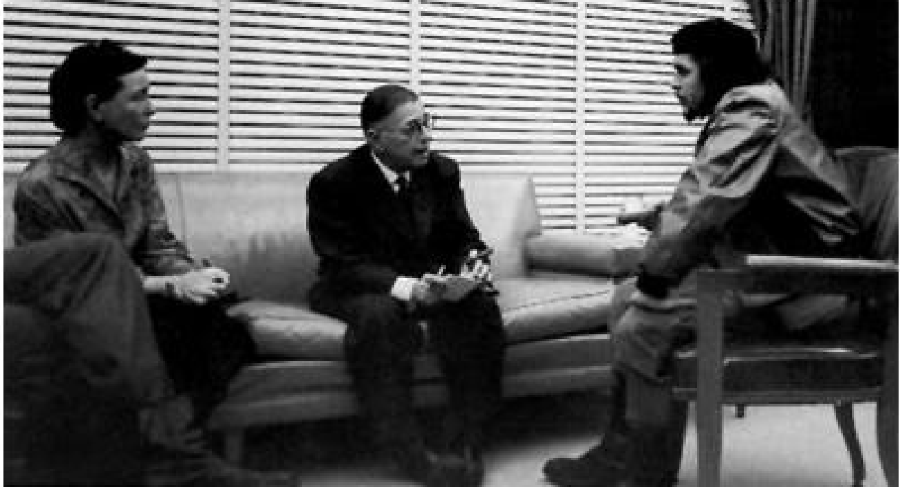
ప్రముఖ ఫ్రెంచ్ తాత్వికుడు రూపాల్ సార్తో... 1960లో సార్త్ర్ క్యూబా సందర్శించినపుడు తీసిన ఫోటో (మధ్యలో వ్యక్తి సార్త్ర్)