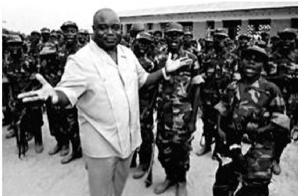
కాంగో మాజీ అధ్యక్షుడు లారెంట్ కబీలా