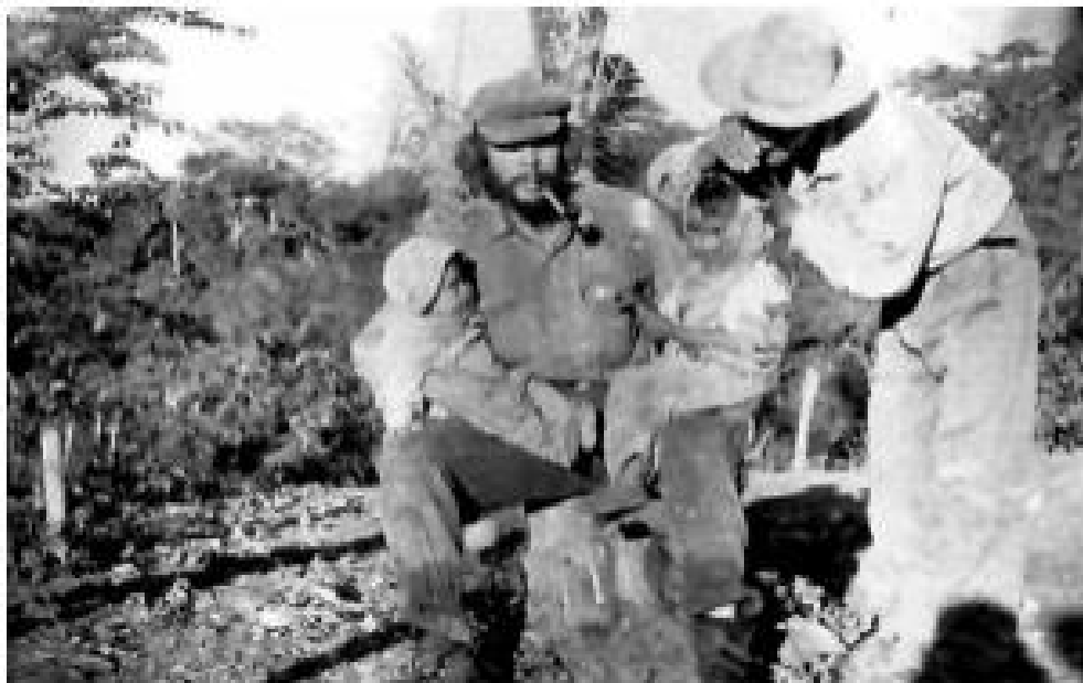
బొలీవియాలోని ఓ గ్రామంలో - 1967