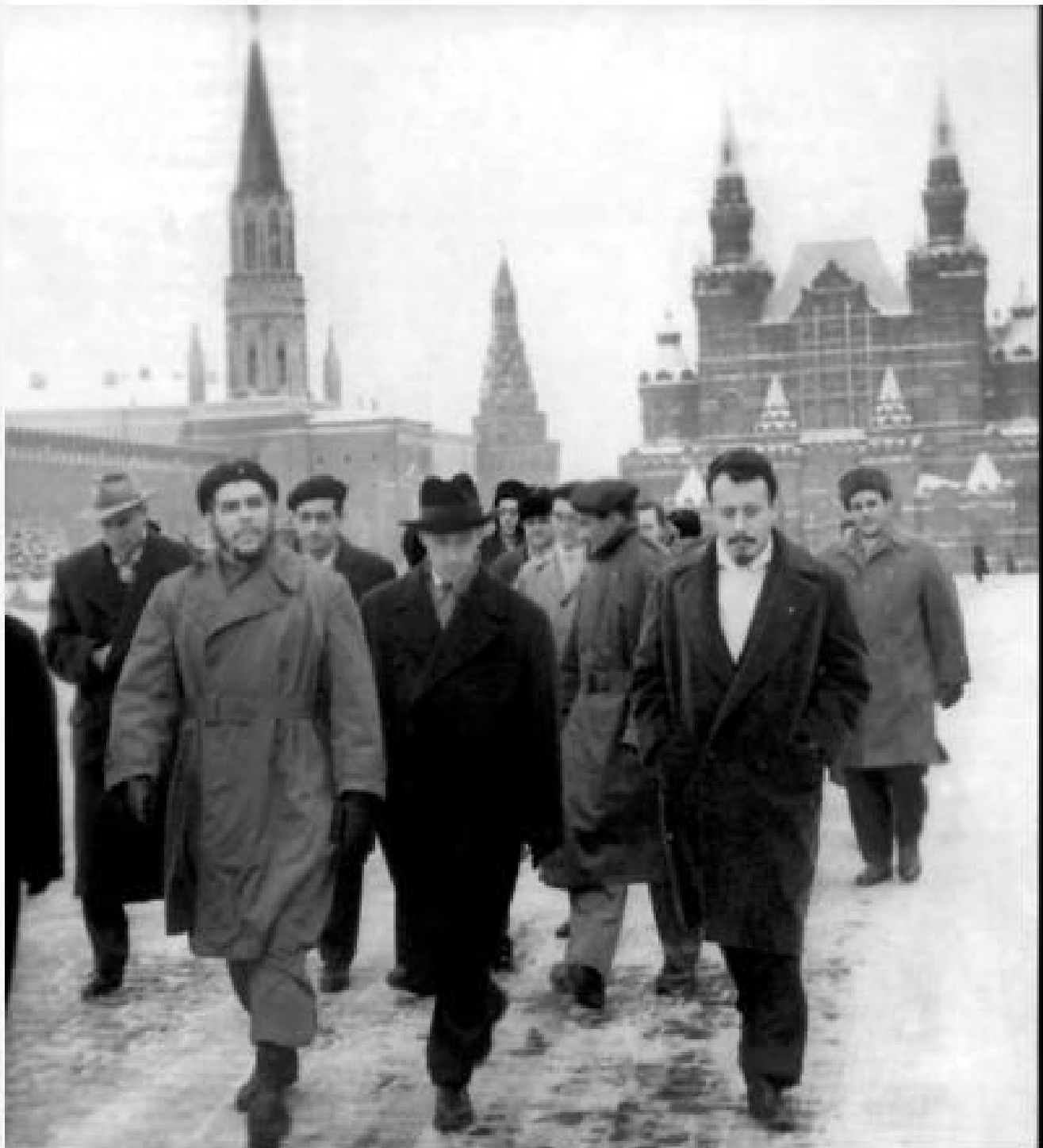
మాస్కోలోని రెడ్ స్క్వేర్ లో చే గువేరా (1964)