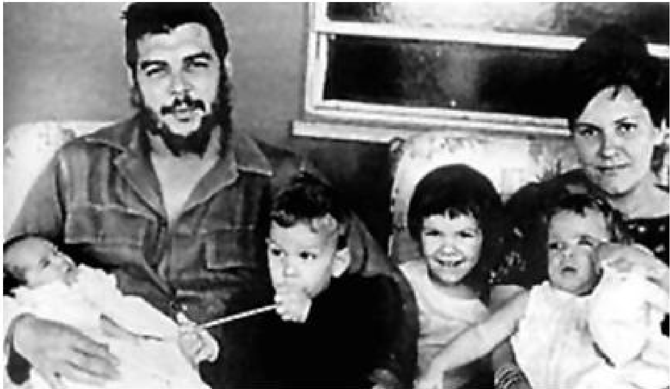
భార్య, పిల్లలతో చే