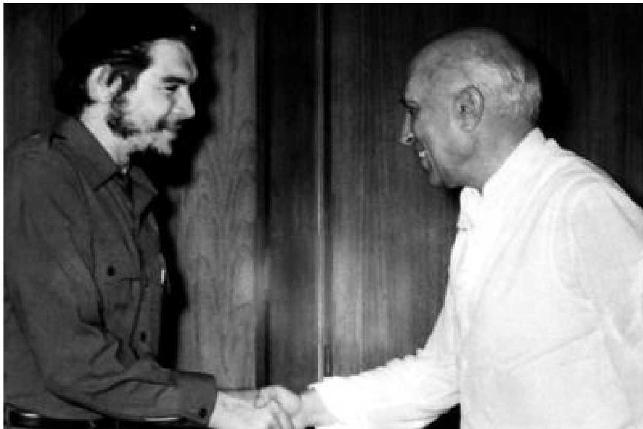
భారత ప్రధాని నెహ్రూతో చే (1959లో ఇండియాను సందర్శించిన చే)