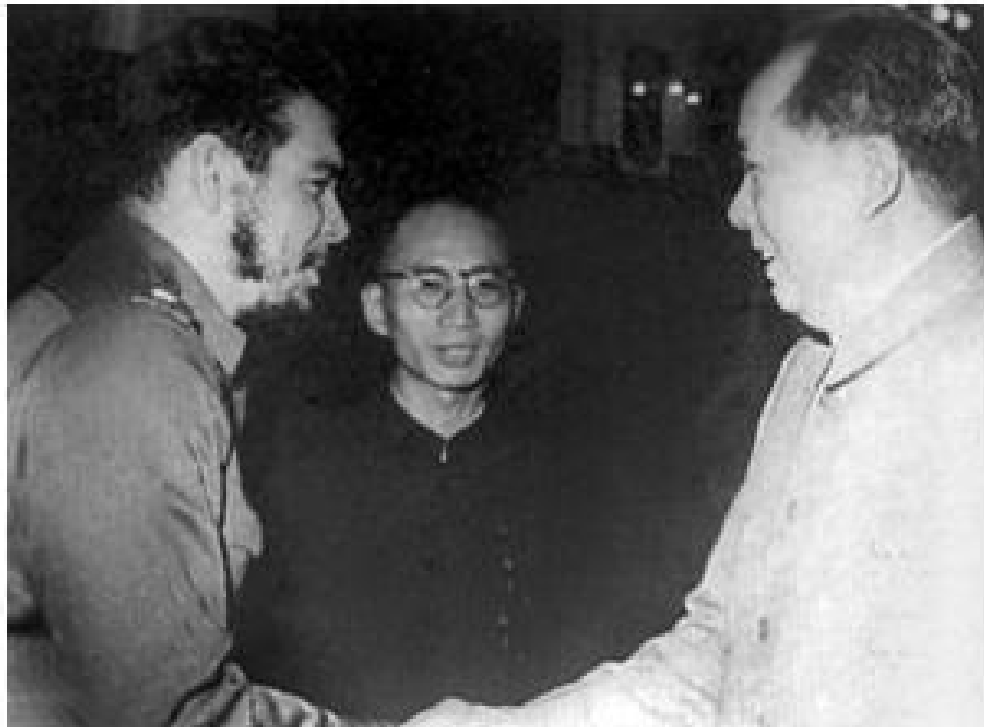
వైనాను సందర్శించినప్పుడు మావోతో చే - 1960