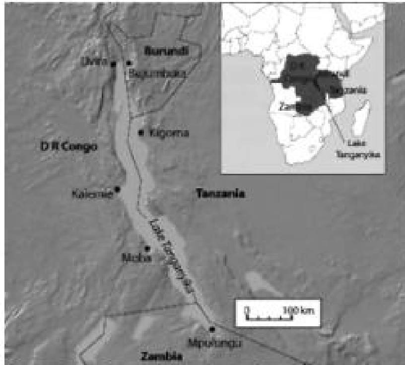
టాంజానియా సరస్సు మ్యాప్