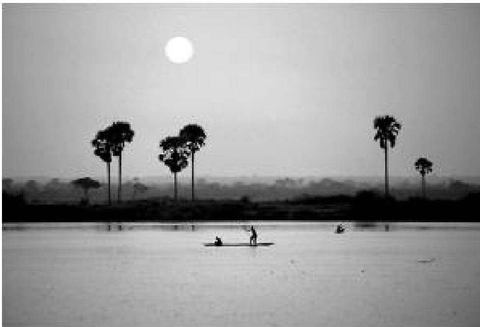
కాంగోలోని ఓ ప్రకృతి దృశ్యం